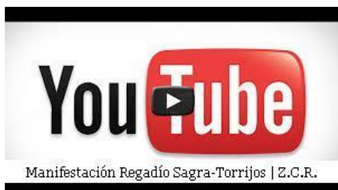
Manifestación Regadío Sagra-Torrijos, 2014