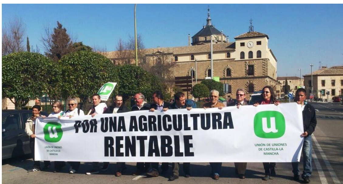
Reivindicación por una agricultura Rentable | Z. Cedillo, 2014

La obra de los Ministerios de Fomento y Agricultura, en 1985, llega hasta a la Junta de Comunidades de Castilla-La Mancha, con el fin de transformar las parcelas de cultivo de secano en agricultura de regadío, para competir en un mercado europeo único, donde los municipios de Cabañas de la Sagra, Magán, Mocejón y Olías del Rey, forman el Regadío Sagra-Torrijos sectores 1 y 2. Sin embargo, a fecha de hoy, la infraestructura no es del agrado de todos los agricultores de la Comunidad de Regantes.