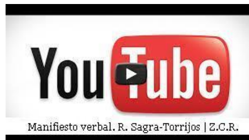
Manifiesto verbal. R. Sagra-Torrijos, 2014

Las comunidades autónomas se contagian con el efecto de los regadíos pendientes de ejecución correspondientes a planes antiguos , que nunca llegaron a finalizarse, como Riaño , Monegros II y La Sagra-Torrijos .