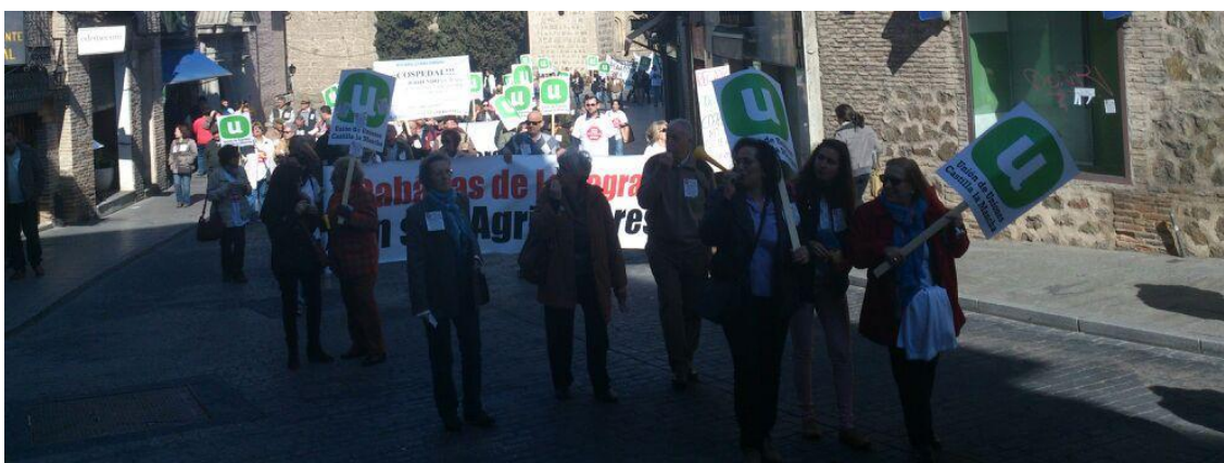
3ª Manifestación Regadío Sagra-Torrijos | Z. Cedillo, 2014

El problema de quienes quieren regar y quienes no están dispuestos a ello crece al hablar de cifras económicas. Unos se muestran a favor del progreso agrícola derivado de un regadío que tiende a la modernización, otros acusan a una herencia que les provoca muchas dificultades de soportar. Mientras tanto los que consumen agua ven los logros de su elección, y los que no consumen, no aceptan los pagos incrementados en conceptos de energía eléctrica, que supuestamente no han consumido.