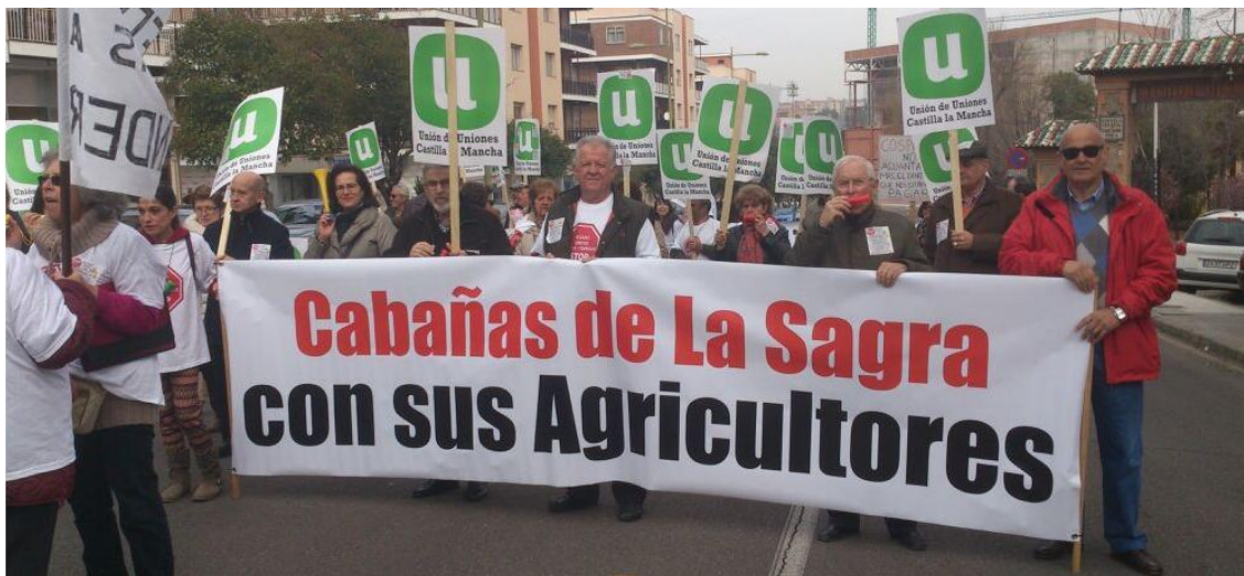
Manifestación de regantes de La Sagra-Torrijos

pasando de 70.000 hectáreas, en un principio, a 20.000 hectáreas., de las que 15.000 corresponden al Canal de Albacete y el resto de la zona de La Sagra.